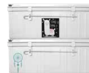
Lama - Dreamcatcher