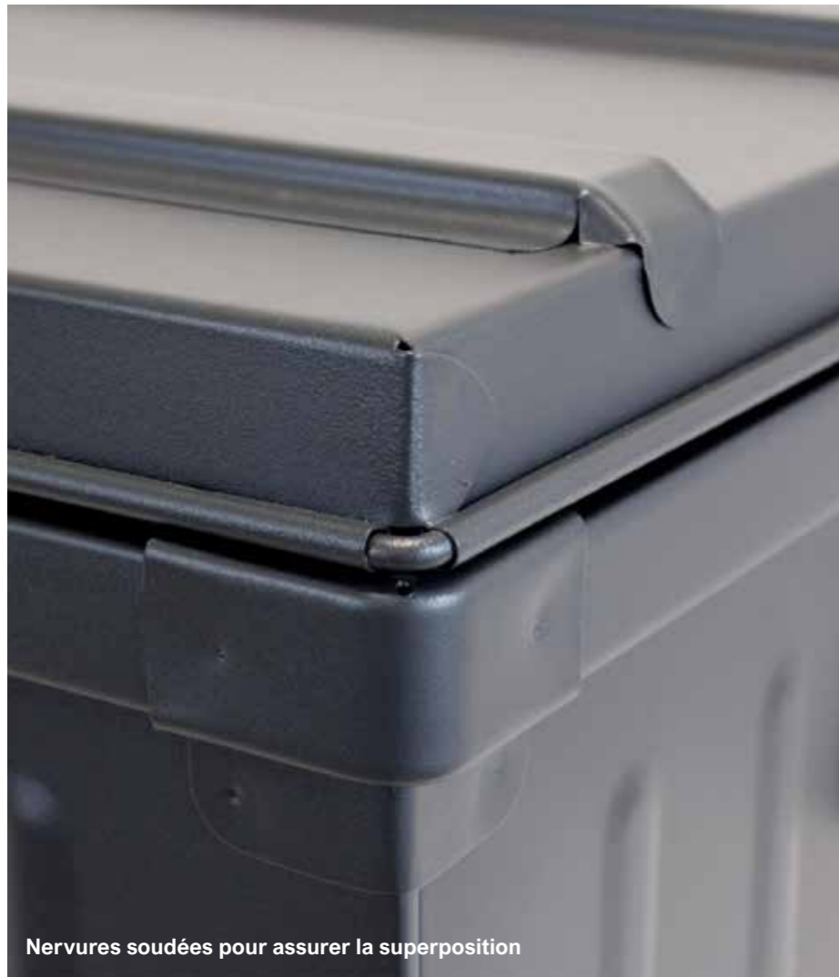
Nervures soudées pour assurer la superposition