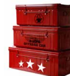
Pompier - stars